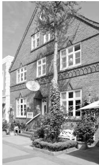
Große Straße 4 (Alt Wyk)

Da die Postbeförderung der Post-Casse profitabel erschien,