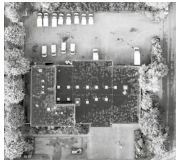
Die Post in der Feldstraße.