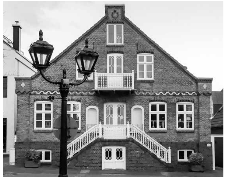
Große Straße 40 (am Glockenturm)

Inzwischen wurden alle kleinen Posthaltestellen in den Dörfern geschlossen. In einigen Orten kann man heute in Geschäften seine Postsachen befördern lassen. In Nieblum wurde die Frist bis zur Schließung der Post etwas verlängert, damit die Fa-