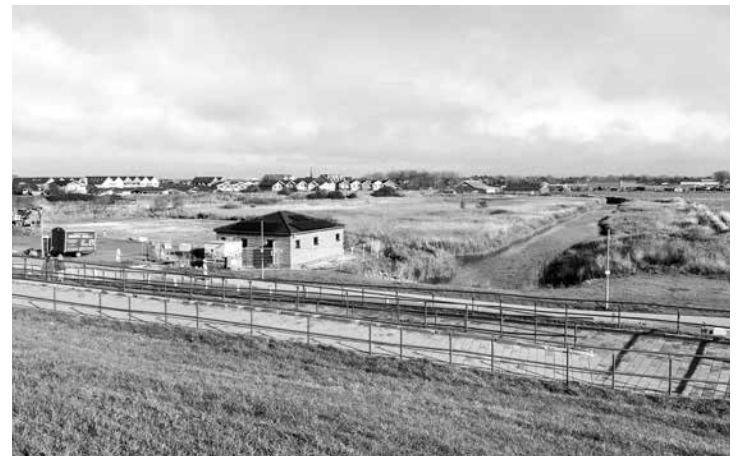
Blick hinter den Klimadeich

digen kulinarischen Angeboten, wie Late-Deich-Shopping, Halloween-Party und Weihnachtsmarkt werden nicht nur Urlauber angezogen, sondern Einheimische aus dem gesamten Kreisgebiet. Dass Dagebüll damit zum ‚Mittelpunkt des Norden‘ aufgerückt ist, wie es auf dem Wegeverzeichnis mit den Nordic-Walking-Strecken aufgeführt steht, mag zweifelhaft erscheinen, das vorherrschende Reizklima sorgt wohl für den Gefühlsüberschwang. Gespannt darf man sein, ob und wann die große, toll ausgeleuchtete Freitreppe am gepflasterten Sammelplatz gegenüber dem Hotelkomplex zum touristischen Reiber wird. Die Stufen führen den Seedeich hoch, aber auf der anderen Seite geht es nicht runter oder weiter, ein Treppenwitz? Ob Vogelkiek oder geführte Wattwanderung, bevor erst der