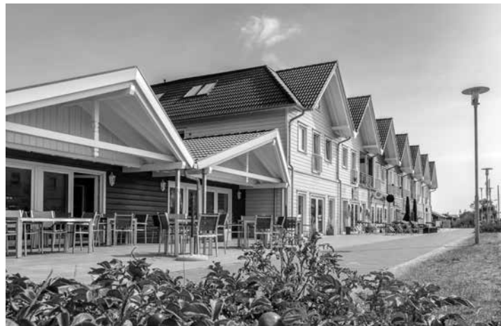
Dagebüll – Vom „hässlichen Entlein“ zum schönen Urlaubsort

sitiven Eindruck bestätigten. Von berufener Seite kam dabei der Hinweis, ein zweites Büsum (touristisch gesehen) werden zu können. Doch allein das Fehlen einer in der Planung vorgesehenen Lagune lässt diesen Vergleich nicht zu. Aus finanzieller Notlage war es nicht möglich, eine erwünschte Badestelle,