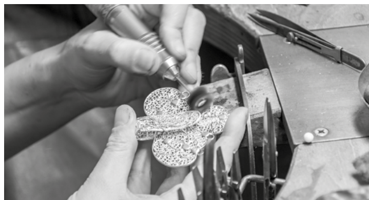
Aufarbeitung eines Friesenschmuckstücks aus Silberfiligran.

diese müssen vorrangig bearbeitet werden damit sie die Trägerinnen zum großen Festumzug zum 200-jährigen Seebadjubiläum der Stadt Wyk hervorheben können. Friesenschmuck wird von Meisterin Ilke gereinigt und bei Bedarf instandgesetzt. Neuer Schmuck wird von ihr nicht angefertigt, denn der hohe Zeitaufwand führt natürlich zu hohem Kostenaufwand, die Filigranschmuckstücke würden sehr teuer. So ist die Freude am Friesenschmuck aber dank Handwerkerkunst aus Portugal dennoch gewährleistet.