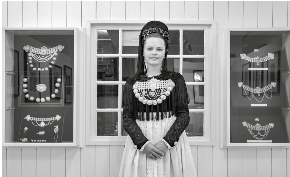
Föhrerin in Tracht vor dem ausgestellten Friesenschmuck im Wyker Friesenmuseum.

Im Rahmen des Jubiläums „200 Jahre Seebad Wyk“ ist ein Umzug durch Wyk geplant, in welchem die verschiedenen Stationen der Entwicklung des Seebades gezeigt werden sollen. Dafür ist beabsichtigt 200 Frauen in Föhrer Tracht zur Teilnahme zu motivieren.