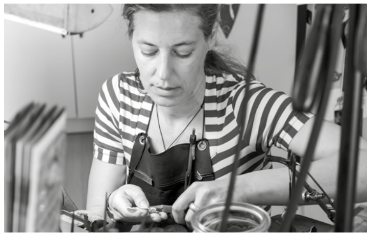
Die Goldschmiedemeisterin bei der Arbeit.