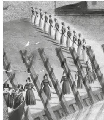
Friesinnen in Tracht stehen 1842 Spalier bei der Ankunft König Christian VIII von Dänemark in Wyk auf Föhr.

um die Schultern gelegt, dass die Spitze in der Mitte des Rückens liegt, der restliche Stoff wird um den Ausschnitt herum in Fältchen drapiert und mit ca. 60 schwarzen Glaskopfstecknadeln am Mieder festgesteckt. Das Kopftuch besteht aus einem Vierecktuch aus schwarzem Wollmusselin, das eingerollt um den Kopf geknotet wird. Es ist ebenfalls teilweise mit Seidenfransen eingefasst. Dazu ist an einer genau ausgemessenen Stelle der „Rahmen“ aufgenäht, das ist ein Samtstreifen,