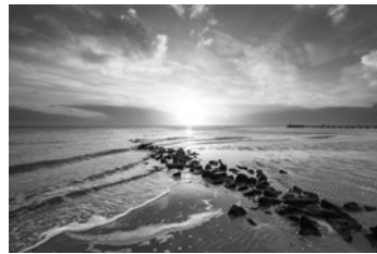
Bühne am Wyker Oststrand