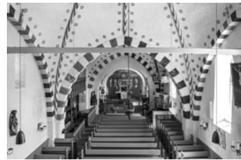
St. Nicolai in Boldixum