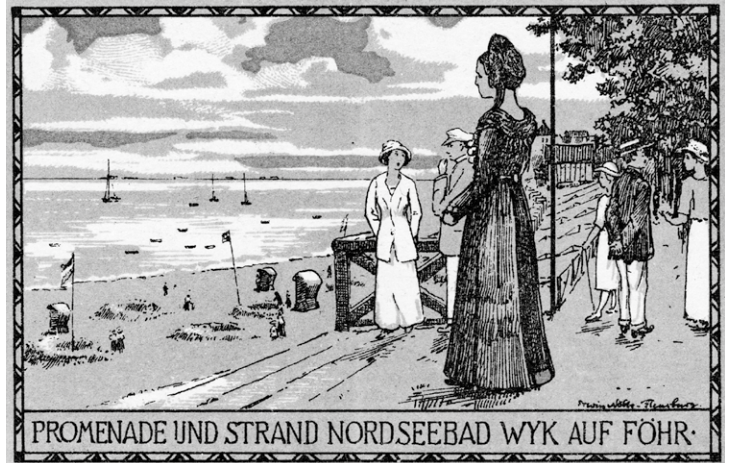
Die „20er“ Jahre am Wyker Strand.