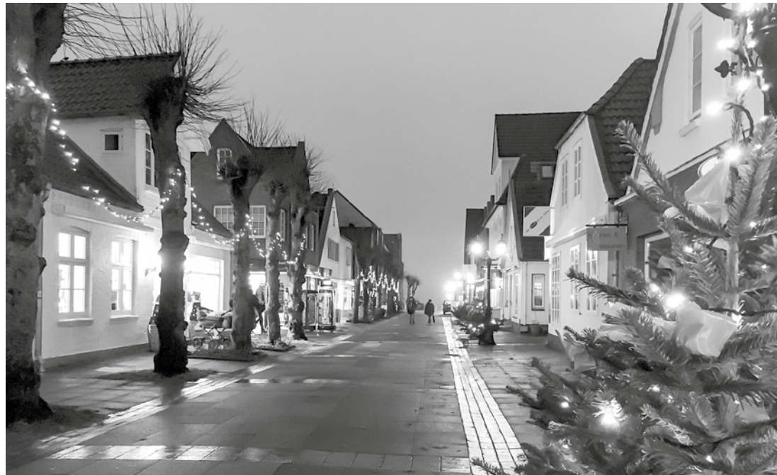
In der Advents- und Weihnachtszeit wird es auf Föhr auch heute noch besonders gemütlich.