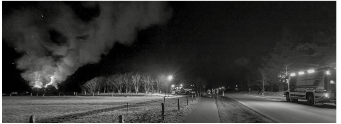
Auch das gehört dazu: Die Freiwillige Feuerwehr sichert das Biikefeuer 2018 am Fehrstieg.

Im Jahre 1857 am 7. Mai wurde der kleine Flecken Wyk von einer verheerenden Feu-