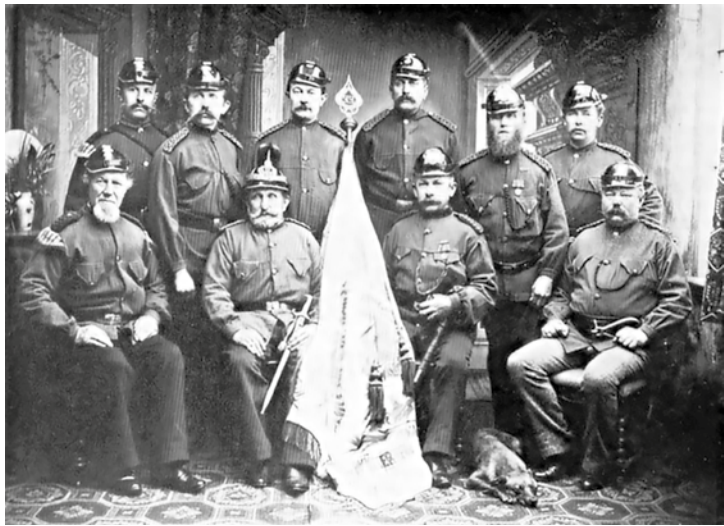
Der Vorstand der Wyker Feuerwehr bei der Gründung.

Noch Anfang des 20. Jh. gab es in Wyk einen Nachtwächter, der auf seinem Gang durch die nächtlichen Straßen, mit seinem stündlich erschallenden Lied die Menschen vor einer solchen