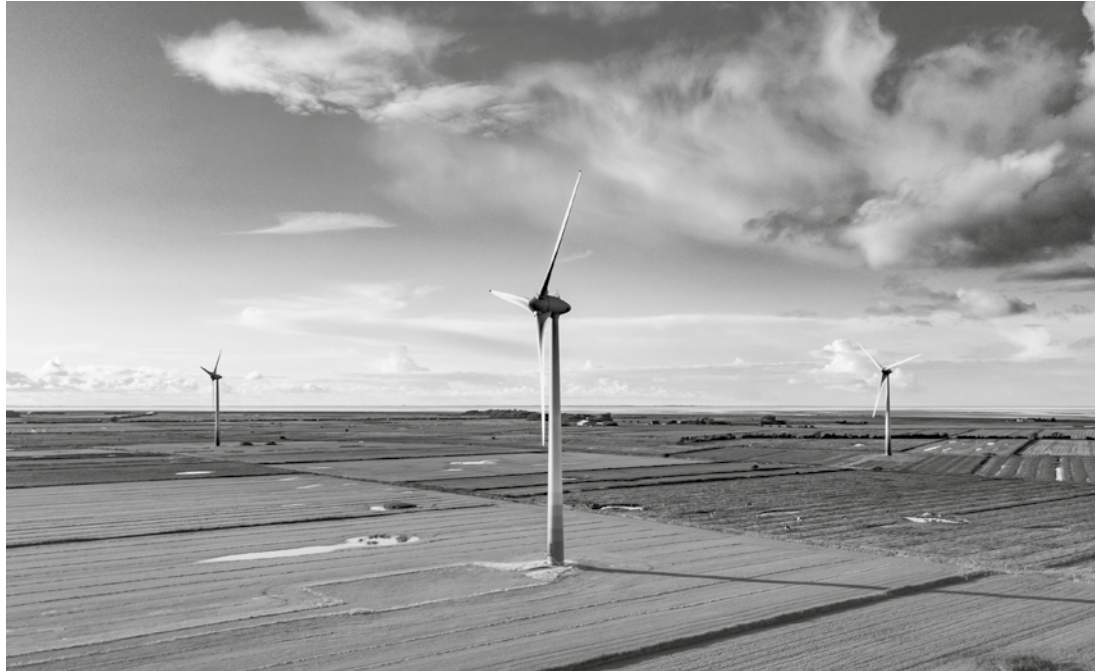
Die drei „Windmühlen“ in der Föhrer Marsch

Schneidender Ostwind bringt den Transport von und nach der Insel immer erneut zum Erliegen, wenn wegen Niedrigwassers die Fähren die Dagebülter Hafeneinfahrt nicht anlaufen können. Der Blick hinüber zur „Eilun Feer“ verdeutlicht: Bei diesem Wind bewegt sich hier überhaupt nichts! Aber drei Windmühlen bewegen sich und grüßen mit unbändiger Rotationsgeschwindigkeit von Föhr zum Festland. Die Reisenden klagen, die Windmüller jauchzen!