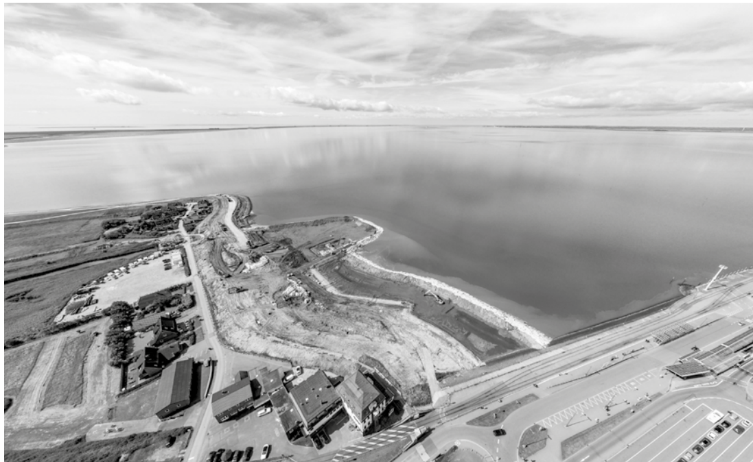
Die Baustelle mit vorgelagertem Hilfsdeich von oben (Juli 2017)