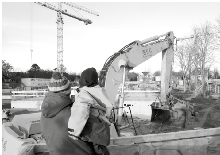
Die Aussichtsplattform an der Baustelle wird rege genutzt.

Noch gab es wegen Herbststürmen keine Verzögerungen. Die Bodenplatte für den Hotelkomplex ist fertig, das Untergeschoss wird Mitte Dezember fertiggestellt sein. 60 Leute, darunter je 15 Einschaler und Betonbauer sowie 30 Stahlfacharbeiter beleben wie Ameisen das Gelände. Verfüllarbeiten werden von der Wyker Tiefbaufirma getätigt. Um möglichst wenig mit den Bauarbeiten zu stören, wird strikt auf Bauzeiten geachtet. Von 8 Uhr bis 13 Uhr und von 15 bis 20 Uhr wird „in die Hände gespuckt“, am Samstag ist Dienst von 8 bis 13 Uhr. Die Arbeiter der Göttinger Bau-