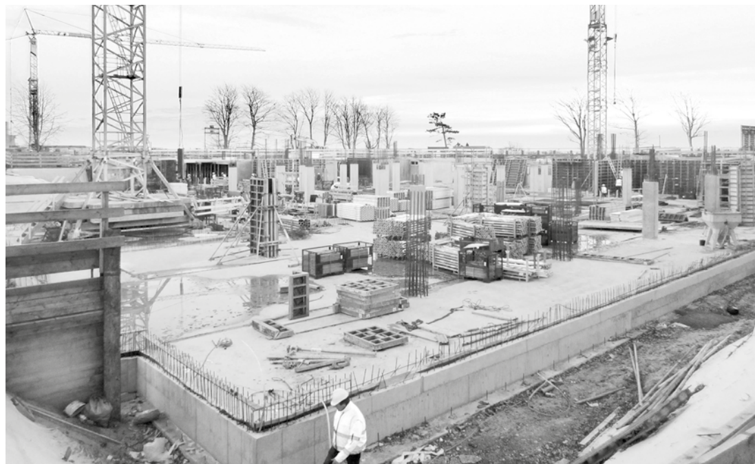
Das 4-Sterne-Superior-Hotel am Wyker Südstrand nimmt langsam Formen an

Laut Pressemitteilungen ist der Schlafstrandkorb Deutschlands Tourismus-Projekt des Jahres. Doch das gilt wohl eher im Bereich der Ostseeküste. Im Land zwischen den Meeren, in denen laut anderweitiger statistischer Erhebungen die glücklichsten Bundesbürger leben und man auf zusätzliche Bettenkapazität setzen sollte, wäre ein Schlafstrandkorbprojekt etwas zum Kleckern und nicht zum Klotzen! Auf der Grünen Insel wird Letzteres verfolgt. Der Fährankömmling hat die weißen, festländischen Mühlenwindräder im rückwärtigen Blickfeld und wird von den gigantischen Kränen am Wyker Sandwall, quasi als Gegenpol, zum Hingucken animiert.