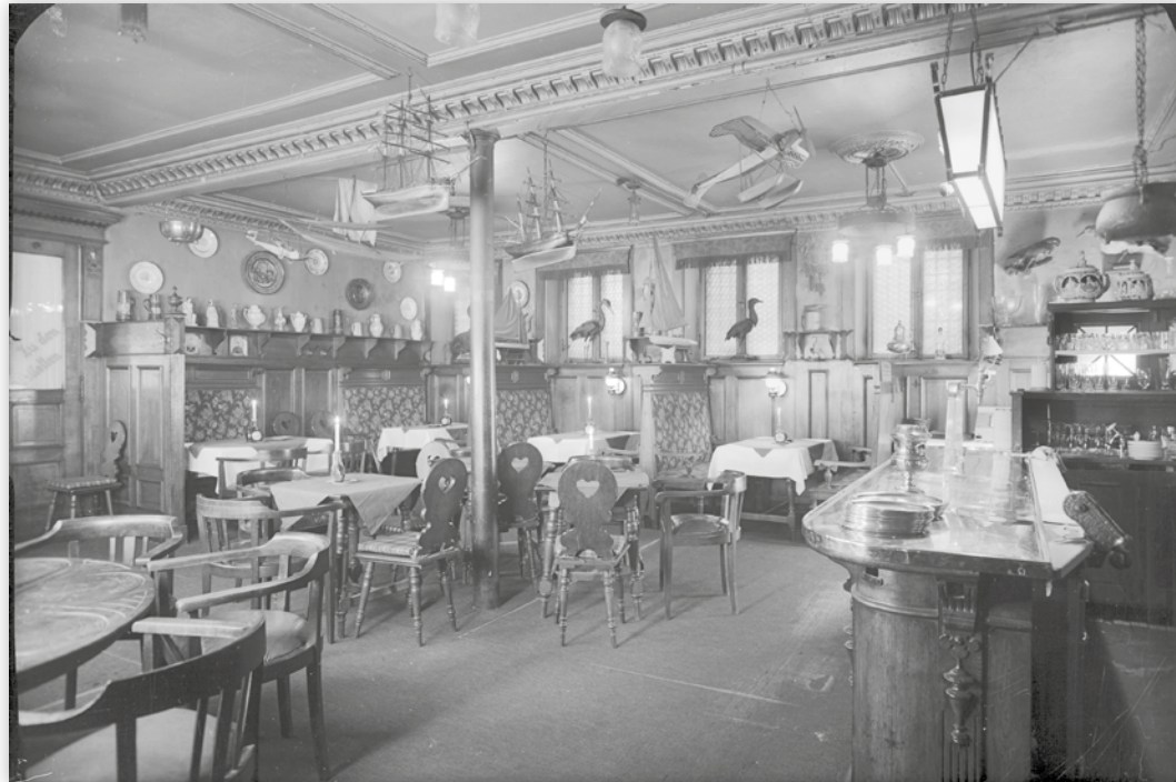
Der ehemalige Altdeutsche Keller

kannt. 1819 wurde in Wyk das Seebad gegründet und man mußte für die zu erwartenden Gäste die Möglichkeit zur Verpflegung schaffen. Der Apotheker Becker, Mitbegründer des Seebades, organisierte für die im ersten Jahr hier weilenden 61 Gäste einen Mittagstisch. In der folgenden Zeit wurden der steigenden Gästezahl entsprechend, mehr Möglichkeiten geschaffen, dies besonders als der dänische König Christian VIII von 1842 bis 1847 in Wyk Sommerresidenz hielt.