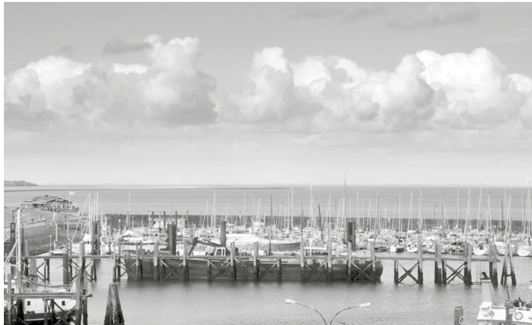
Gut geschützt liegen die Sportboote an den Schwimmpontons im nördlichen Teil des Hafens.

„Seefahrt ist not(wendig)“, so steht es bereits bei den antiken Seefahrernationen festgeschrieben und im Lateinunterricht gab es dazu die passende Übersetzung mit der leicht zu behaltenden Vokabel „navigare“, denn die Navigation gehört heute zum täglichen Sprachgebrauch. Durch Johann Kinau, dem legendären „Gorch Fock“, erhielt dieser Spruch sogar eine literarische Bedeutung. Als Inselbewohner weiß man natürlich über die Notwendigkeit und Überlebensbedeutung der Seefahrt. Aber die Zeit der Walfangseefahrt, der Auswandererseeereisen und der Krabbenflotten sind Vergangenheit. Heute denkt man eher an: „Seefahrt ist fun!“ Es geht uns sehr gut, die ständig steigenden Zahlen von Kreuzfahrtgiganten belegen das. Auch das Freizeitvergnügen „zur See“ wird unablässig zu neuen Trendsportarten hinführen. Nach dem Surfen und dem Kiten sieht man nun bei ruhiger Nordsee Wassersportfreunde, die dem Stand