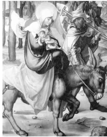
Albrecht Dürer: Die Flucht nach Agypten

Das Thema „Flüchtlinge“ beherrscht nicht nur unsere Medienlandschaft, sondern kommt nach und nach auch in unserem Alltag an. Denn auch auf Föhr kommen Bürgerkriegsflüchtlinge aus Syrien und anderen