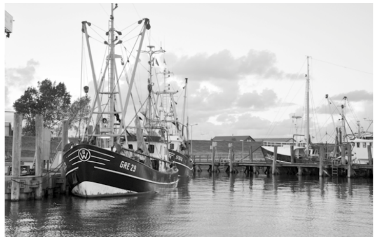
Der Wyker „Fischereihafen“