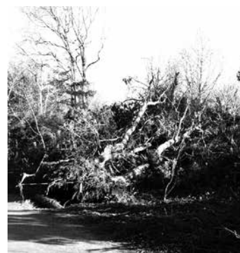
Ein Bild der Verwüstung