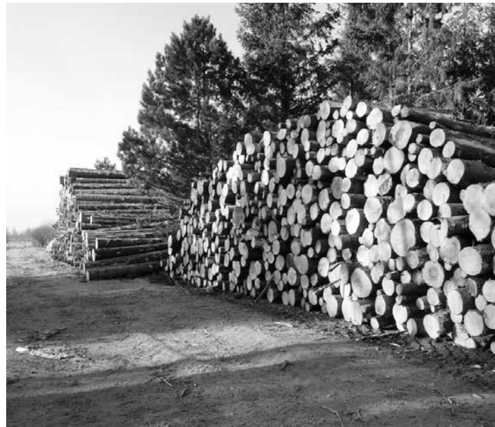
Bereit zum Abtransport ...

Mulchen war eine wichtige Aufräumarbeit, Kulturflächen werden dadurch gestärkt. Tannen und Sitkafichten haben durch den Windwurf besonders gelitten, ein „Buchenunterbau“ soll Abhilfe schaffen. Die Waldwege wurden stark in Mitleidenschaft gezogen, inzwischen wurden sie befestigt und laden die Waldwanderer zum Betreten ein.