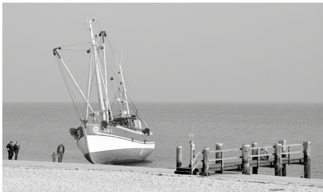
Ein seltenes Bild: Krabbenkutter am Wyker Hafenstrand

Auch heute noch wird ungeprüft die These verbreitet, dass der Ort Wyk bei der Entstehung ein Fischerdorf gewesen sei. Stellt man sich aber die damalige Zeit um 1600 vor, darf man sich nicht an den heutigen Gegebenheiten orientieren.