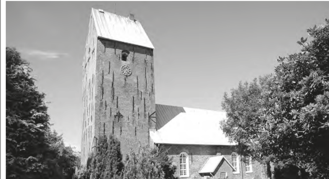
Bis zum Lutherjahr 2017 soll der Turm der St. Nicolai-Kirche saniert sein.

Christliche Namen sind nicht unbedingt zwingend Gewährleistung für christliches Handeln der besagten Namensträger. So hat Orkan „Christian“ im Kirchenkreis Nordfriesland dermaßen „unchristlich“ gewütet, dass laut ersten Schätzungen eine Dreiviertel-Million Euro Schadensbilanz an den Gotteshäusern zu verzeichnen ist.