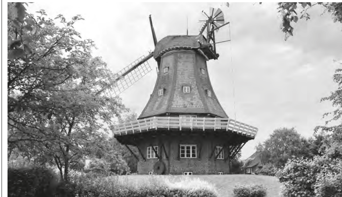
Die Wyker Mühle heute, leider in nicht so gutem Zustand.

Heute gibt es auf der Insel Föhr nur noch drei große Windmühlen; in früherer Zeit stand in fast jedem Dorf eine Mühle, manchmal sogar zwei. Man fragt sich, weshalb so viele Mühlen auf einer relativ kleinen Insel gebraucht wurden, zumal in einer Zeit als die Seefahrt hoch in Blüte stand und Landwirtschaft nur in geringem Umfang betrieben wurde. Es konnten unmöglich so große Mengen Getreide angebaut und geerntet werden, um alle Mühlen auszulasten.