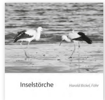
Inselstörche Harald Bickel, Föhr

storch oft ungewöhnliche Bildzusammenhänge.