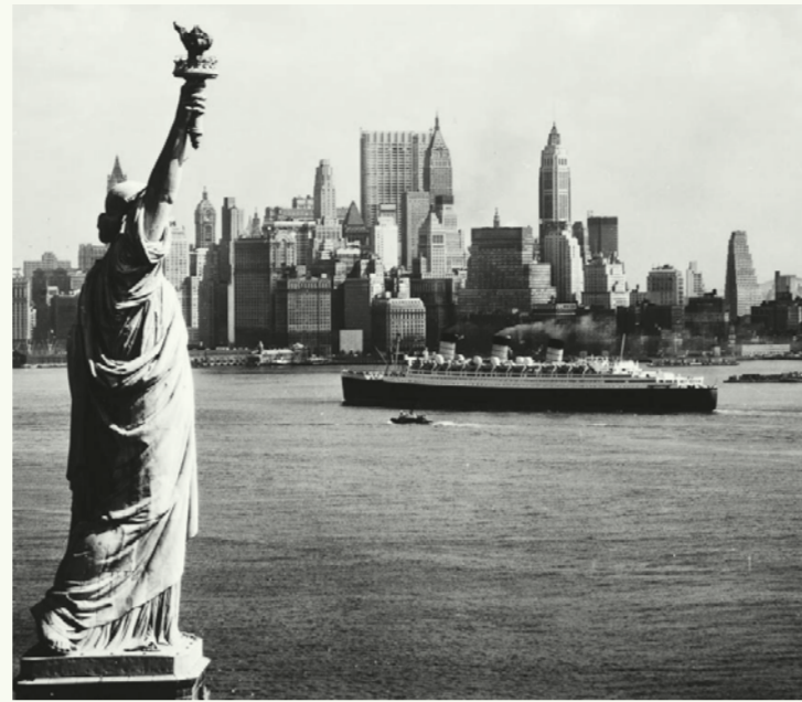
Ankunft in New York (ca. 1950)

Im Laufe der Auswanderungsbewegungen wurden auch die Führer in viele Gegenden