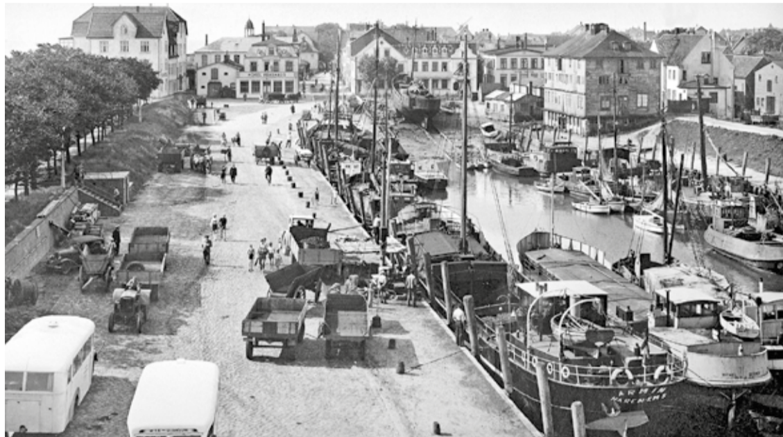
Der Wyker Hafen um 1950

Voraussetzung für die Gründung des Ortes Wyk war der günstige Anlegeplatz für Schiffe an der Ostseite der Insel Föhr. Um 1600 siedelten hier vor allem Menschen welche nach Sturmfluten auf den Halligen obdachlos geworden waren. An der Mündung der Wasserlösung, welche das überschüssige Regenwasser aus dem Osterland-Föhrer Marschkoog in die Nordsee leitete, wurden die ersten Packhäuser errichtet. Hier wurden die angelandeten ebenso wie die zum Abtransport bestimmten Waren gelagert. Einer der ersten Eigentümer eines Packhauses war um 1600 Raurert Arfsten aus Midlum, welcher außer einem Schmackschiff für die Küstenfahrt auch ein hochseetüchtiges Schiff besaß. Die Nachkommen aus dieser Familie wurden später Pastoren, Landvögte, Kapitäne, Lehrer und Landwirte.