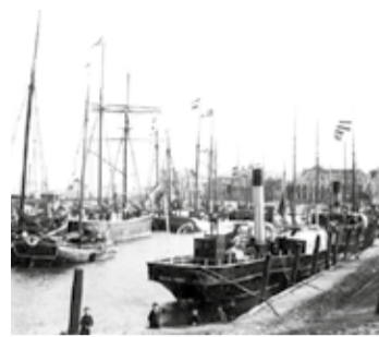
Hafen um 1900

offenbar ein gutes Geschäft, vermögende Bürger und einige Vertreter von Witwen und Waisen legten in deren Auftrag, ebenso wie die St. Nicolai Armenkasse, bereits 1789 z.T. beträchtliche Summen in verzinslichen Obligationen für den Hafenaufbau an.