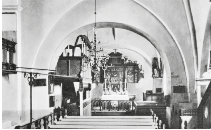
Altarraum mit ehemaliger Empore (ca. 1930)

Im Mittelteil des Altars sieht man das farbig gestaltete Abendmahl, in den vier Ecken werden die vier Evangelisten dargestellt, auf den übrigen vier Feldern, den vier Abbildungen im rechten und linken Seitenflügel, sowie im Aufsatz wird das Leben Jesu dargestellt, hier nicht farbig sondern in einer hellen, marmorähnlichen Bemalung. Die Pedrella im unteren Teil weist auf Plattdeutsch auf die einzelnen Textstellen hin. 1968 wurde der Altar durch einen Schwelbrand stark beschädigt und musste restauriert werden, auch der Kirchenraum wurde durch Ruß stark verunreinigt. Zwei Paar spätgotische Messingleuchter stehen auf dem Altar. Auch diese Gegenstände sind heute gut gesichert, wie es heißt wurden die Leuchter vor Jahren gestohlen und in Paris dem damaligen Schah von Persien zum Kauf angeboten, kehrten aber in die Kirche zurück. Zur weiteren Ausstattung gehört das um 1300 geschnitzte, farbige Abbild des Namensgebers, des heiligen Nicolaus, welcher sitzend auf die versammelte Gemeinde sieht. Das älteste Teil der Ausstattung dürfte der vor dem Al-