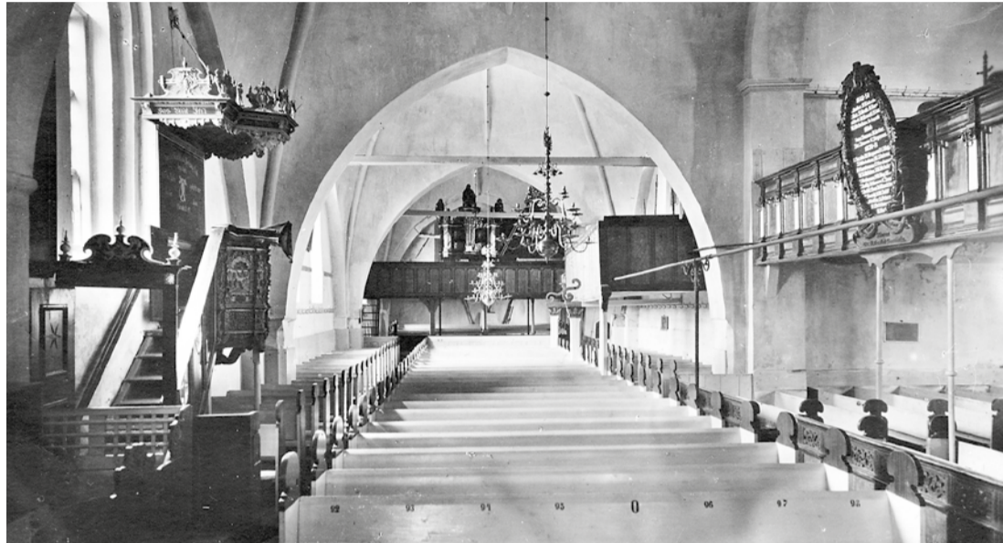
Der Innenraum der St. Nicolai Kirche auf einem historischen Foto (ca. 1930)

Mittelpunkt der drei Föhrer Ortschaften Wrixum, Boldixum und Wyk ist seit etwa 800 Jahren die Kirche St. Nicolai. Ein genaues Baudatum ist nicht zu bestimmen, aber im Erdbuch des dänischen König Waldemar Sejr (der Sieger) wird 1240 auch diese Föhrer Kirche genannt, das bestätigt ebenfalls der Münzfund, welcher 1707 beim Anbau des Norderflügels, auch „Norderstück“ oder „Wyker Schiff“ genannt, entdeckt wurde. Drei Münzen aus dieser Zeit befanden sich in einer Kapsel, sie waren gekennzeichnet mit der Inschrift: „WALDEMAR REX DAN. ET NORW.“ (Waldemar König von Dänemark und Norwegen). Mit dem Anbau des Norderflügels beabsichtigte man Platz für die Wyker Einwohner zu schaffen, denn Wyk war 1706 ein selbständiger Flecken geworden.