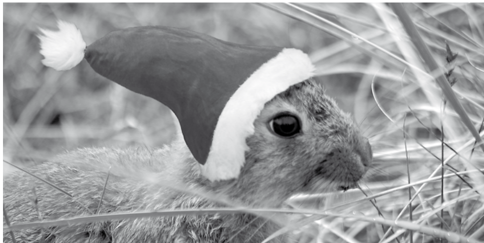
Ein fesches rotes Mützchen für den Osterhasen

Irgendwie gehöre ich zu der aussterbenden Sorte Mensch, für die alles seine Zeit hat, besonders wenn es um Weihnachten und Ostern geht. Was meint sie denn damit, werden Sie fragen, oder ausrufen: wie altmodisch! Also, da muss ich jetzt etwas ausholen.