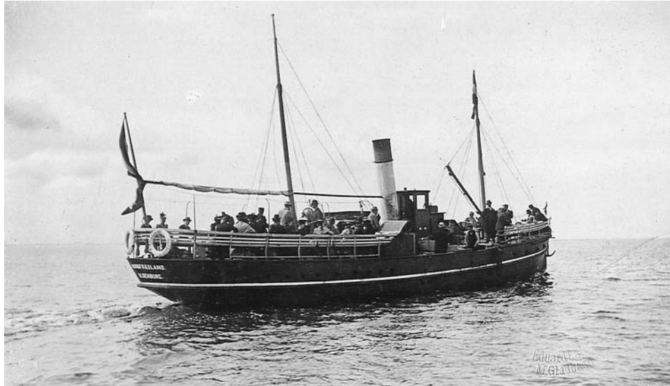
Die Nordfriesland I – Das erste Schiff der W.D.R. mit diesem Namen

die ersten Planungen gestartet. Wie 1906 zur 200-Jahr-Feier der Fleckengerechtigkeit, 2004 zur Wiederkehr der Verleihung der Hafengerechtigkeit und 2006, als das dreihundertste Jahr der Verleihung der Fleckengerechtigkeit begangen wurde, sind auch bei dem anstehenden Stadtjubiläum wieder viele Wyker Bürger ehrenamtlich an der Gestaltung des Festprogramms beteiligt.