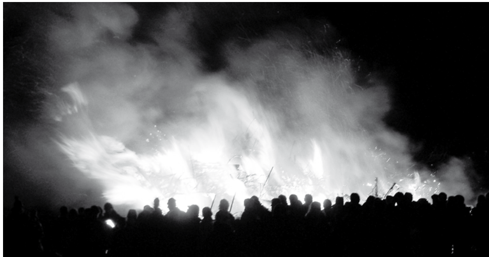
Das Wyker Biikefeuer brennt am Fehrstieg