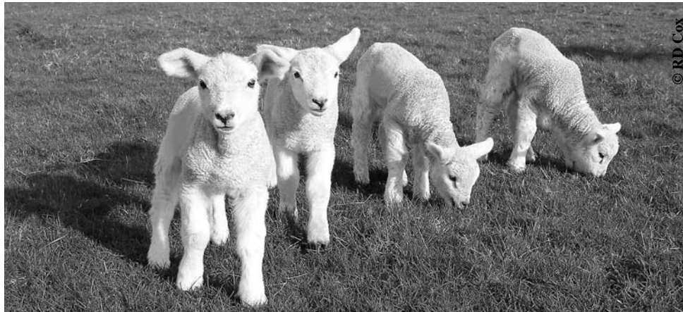
Ein gewohntes Bild zu dieser Jahreszeit – Lämmer auf den Deichen

Im Osternest aus Moos, dem friesischen puaskneest, finden sich neben bunten puaskaier, den Ostereiern, heutzutage auch süße Osterüberraschungen in Gestalt von Hasen, Schmetterlingen, Glückskäfern oder Osterlämmern. In bunter Folie verpackt oder im schokoladenhaften Naturzustand erfreuen sie Groß und Klein am Ostermorgen. Beim Betrachten entfärbt es einem: „Wie süß!“, doch nach geraumer „Anstandszeit“ wird das niedliche Outfit zur Nebensache und der Heißhunger nach der verlockenden Süßigkeit gewinnt die Oberhand: der lustige Schokohase wird aus der Staniolhülle entkleidet und verspeist, dem niedlichen Osterlamm aus weißer Schokolade wird das wollig-krause Köpfchen abgebissen. Für Sentimentalitäten ist nunmehr der Zeitpunkt überschritten!