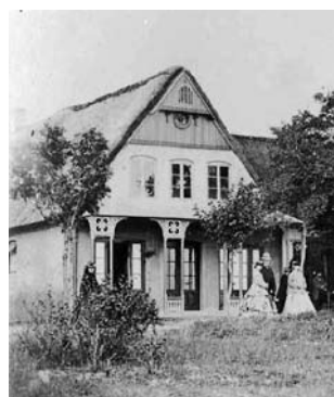
Warmbadeanstalt um 1860

Signal für den Badekutscher mit seinem Pferd die Kutsche an Land zu holen. Das Gebiet für die „kalten Seebäder“ befand sich zwischen dem heu-