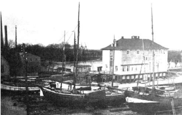
Das Hellinghaus und die Werft um 1900

In der Mitte des 18. Jahrhunderts besaß Jacob Roluf Swart die erste bekannte Wyker Werft, diese befand sich am Sandwall, etwa in Höhe des heutigen Kurhaus-Hotels. Auf vier Hellingungen wurden neue Schiffe gebaut und Reparaturen ausgeführt.