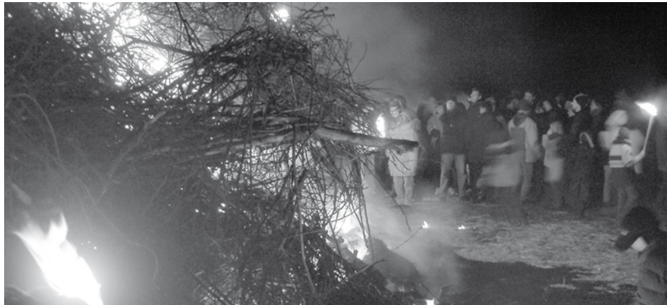
Am 21. Februar brennen wieder die Biikefeuer, auch auf der Nachbarinsel Amrum

Mehr als sechzig „Biike-Feuer“ werden am 21. Februar auf den Inseln, Halligen und in den küstennahen Festlandgemeinden brennen. Wenn die Wetterlage es hoffentlich zulässt, so kann man bei einem abendlichen Rundgang entlang der Wattenmeerküste viele Feuerzeichen, so die Bedeutung des friesischen Wortes „biike“, wahrnehmen. Die Föhrer Insulaner und Urlauber kommen in den Genuss, sämtliche vier Feuerzeichen von der Nachbarinsel Amrum nahezu präsentiert zu bekommen, denn alle Gemeinden lassen ihr Wintervergnügen an der windgeschützten Wattenküste Richtung Föhr abfeuern. Dabei sollten die Feuer doch einst nicht nur den Winter verabschieden sondern auch den wagemutigen Inselmännern, die gemeinsam ihre Seereise nach Hamburg, Holland und weiter Richtung Polarzone antraten, ein langes Abschiedszeichen ihrer Heimatinsel bedeuten.