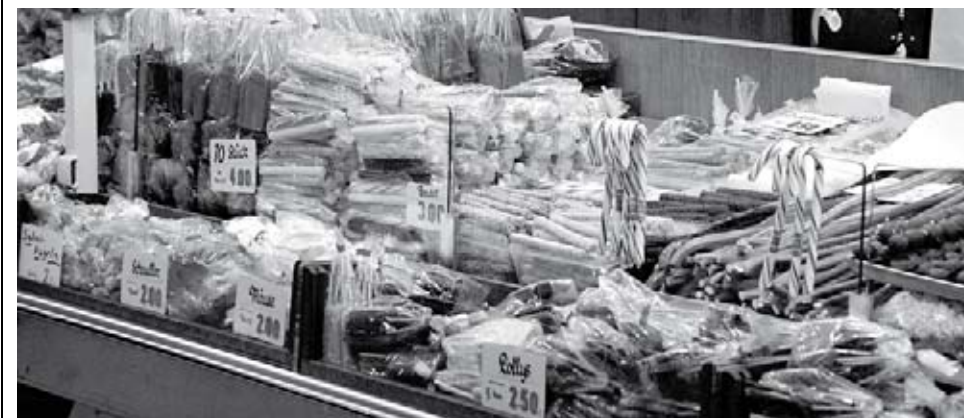
Süßigkeiten gehören heute wie damals zum Jahrmarkt dazu

Der Wyker Jahrmarkt ist auf der Insel Föhr ein besonderes Ereignis. In früherer Zeit gab es zweimal im Jahr Jahrmarkt. Im Frühjahr war es in der Hauptstraße (heute Große Straße) ein reiner „Kram-Markt“. Hier konnte man Gerätschaften und Gegenstände für Haus und Hof erwerben. Als 1857 der verheerende Brand in Wyk ausbrach, war eben der Markt zu Ende gegangen, die Marktleute hatten gerade ihre Habe eingepackt, sonst wäre diese vernichtet worden. Der Frühjahrsmarkt fand im Laufe der Zeit immer weniger Interesse und wurde 1927 eingestellt.