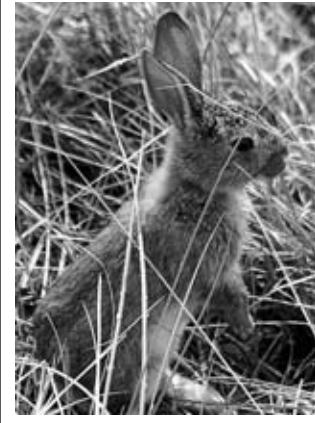
...und viele Kaninchen!

Anfang des 20. Jahrhunderts 100 Hasen aus Böhmen auf der Insel ausgesetzt worden seien. Fakt ist jedoch, dass es schon immer Hasen in der Region Föhr gegeben haben muss. Bereits 1231 sind im Erbbuch des dänischen Königs Waldemar II. Feldhasen bezeugt. Sicherlich haben sich bei den großen Sturmfluten 1362 und 1634 zusätzlich Tiere auf die höher gelegenen trockeneren Landteile gerettet. Mit der Entstehung der Insellage