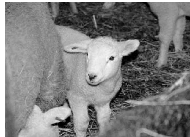
Lämmchen sind jetzt wieder überall zu sehen

Kurz vor Ostern ist es wieder soweit: Täglich werden neue kleine wollige Inselbewohner geboren. Die Rede ist hier von den zahlreichen Lämmern, die nach 5 Monaten im Leib der Schafsmütter