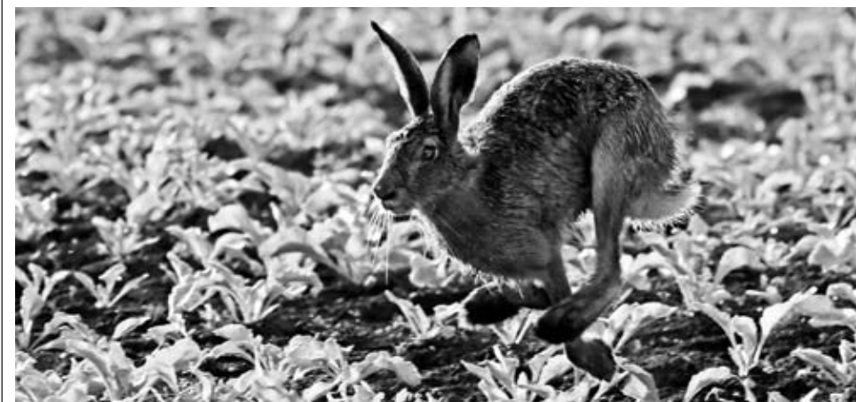
Hasen auf Föhr, viel Platz und wenig Feinde

Der Frühling ist eingezogen und mit ihm erwacht die Natur zu neuem Leben. Während am Himmel manche Vögel jubelnd ihre Kreise ziehen und um die Gunst einer Partnerin werben, sind andere Vögel schon längst mit dem Nestbau beschäftigt.