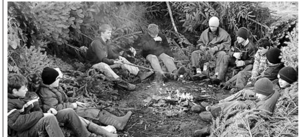
Am gemütlichen Lagerfeuer bewachen Jugendliche den Biikehaufen in Oldsum.

Genauso lange wie es die Biiketradition gibt, existiert auch das ungeschriebene Gesetz, dass die jeweiligen Konfirmanden des Ortes dafür Sorge zu tragen haben, dass der sich allmählich auf-türmende Haufen aus Brennmaterial bewacht wird.