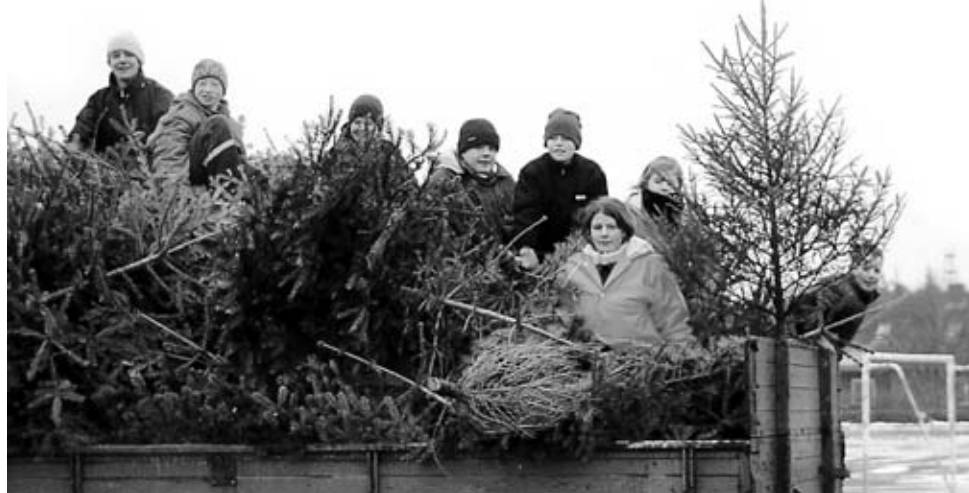
Für die Jugendlichen ist's ein Mordsspaß auf den Hängern zum Biikeplatz zu fahren.

Ihnen ist kein Baum zu schwer oder zu stachelig. Die vielen kleinen und größeren Feuerwehrmänner und -frauen der Jugendfeuerwehren Wyk und Boldixum sammeln bei Wind und Wetter alljährlich die ausgedienten Weihnachtsbäume ein und fahren sie zum Biikeplatz am Fehrstieg.