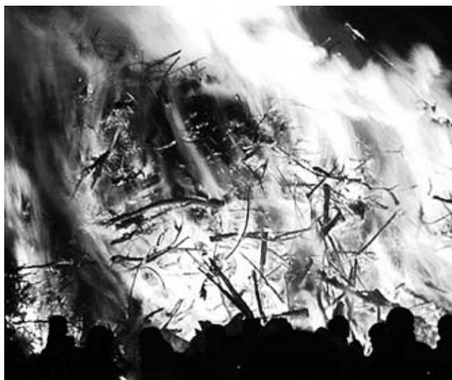
Das Biikebrennen gilt heute als friesisches Nationalfest.

Das Biikebrennen auf den Inseln und den Halligen der nordfriesischen Uthlande wird heute am 21. Februar, dem Abend vor Petritag (Petri Stuhlfeier) gefeiert. Das friesische Wort Biike bedeutet Zeichen, Seezeichen (Bake) oder Feuermal.