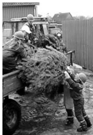
Beim Aufladen der pieksenden Tannenbäume ist Teamarbeit gefragt.

Ist der Anhänger voll, geht's zum Biikeplatz. Schnell abladen, vielleicht noch einen kurzen Klönschnack mit den Freunden aus der anderen Gruppe halten, die auch ge-