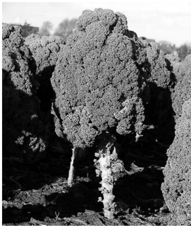
Schon die Römer bauten vor 2400 Jahren Grünkohl an.

Mitte Juni pflanzt Meister dann die ersten zarten Pflänzchen. Die sind aus ungebeiztem Saatgut hervorgegangen. Im konventionellen Anbau wird das Saatgut gebeizt. Das bedeutet, dass es mit einer Chemikalie behandelt wird, die bis in die später Vegeta-