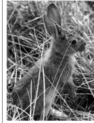
...und viele Kaninchen!

Anfang des 20. Jahrhunderts 100 Hasen aus Böhmen auf der Insel ausgesetzt worden seien. Fakt ist jedoch, dass es schon immer Hasen in der Region Föhr gegeben haben muss. Bereits 1231 sind im Erbbuch des dänischen Königs Waldemar II. Feldhasen bezeugt. Sicherlich haben sich bei den großen Sturmfluten 1362 und 1634 zusätzlich Tiere auf die höher gelegenen trockeneren Landteile gerettet. Mit der Entstehung der Insellage