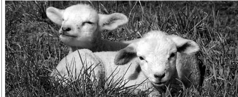
So niedlich wie sie sind, ein Großteil der zarten Lämmchen landet doch als Delikatesse im Kochtopf.

Wenn die Schafe wieder auf den Föhner Deichen grasen, ist der Frühling nicht mehr weit. Und besonders anrührend sind dabei die niedlichen Osterlämmchen, die übermütig die Deichkronen unsicher machen. Doch so niedlich die Schäfchen sind wenn sie klein sind, so wichtig sind sie auch wenn sie erst groß sind, für den Küstenschutz des Landes. Denn, obwohl der Mensch heute in der Lage ist mit modernster und aufwendigster Technik riesige Deiche zu bauen, wenn's sein muss auch in kürzester Zeit, sie anschließend zu pflegen und vor übermäßigem Bewuchs zu schützen, dafür benötigt er noch immer die Schafe.