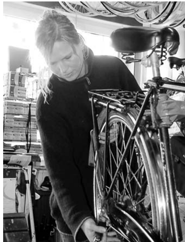
Frühjahrscheck für Ihren Drahtesel: Selber schrauben oder in der Fachwerkstatt.

Endlich Frühling! Endlich wieder Ausflüge mit Fahrrad. Also raus mit Rad aus dem Winterlager. Doch herrje, was muss man feststellen? Das alte Schätzchen hat den Winter im feuchten Schuppen nicht sonderlich gut überstanden. Seeluft macht Menschen hungrig und - beim Blick auf den Drahtesel wird's deutlich - metallene Dinge leider auch rostig.