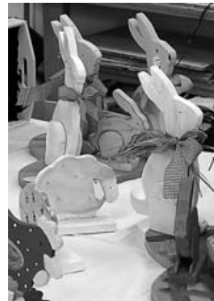
Holzhasen mit Schleife, natürlich selbst gemacht!

Da es in vielen Illustrierten und auch im Internet für jede Altersklasse die richtigen Ideen gibt, bietet es sich an, gleich Kinder, Eltern und