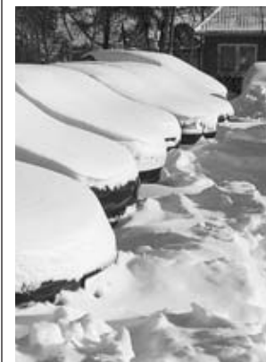
Verschneite Autos auf Föhr

richtig eingestellt sind. So wird der entgegenkommende Verkehr nicht geblendet und das eigene Fahrzeug wird frühzeitig gesehen,“ erklärt der 57jährige. Darüber hi-