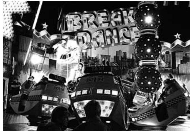
Rasanter Fahrspaß auf dem Föhrer Jahrmarkt

die es lieber rasanter mögen, ist der „Streetfighter“ und der „Break Dance“ genau das