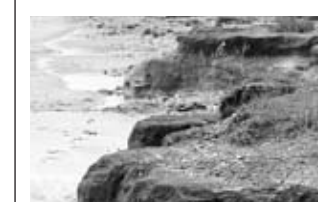
Landverluste bei Goting

Seit Siedlingsbeginn im 7. Jahrhundert kämpfen die Bewohner der Küstenregion gegen die Sturmfluten und den Landverlust. „Heutzutage gibt es einen organisierten Küstenschutz, der in jedem Jahr bis Ende September eine Sturmflutbereitschaft aufbaut“, berichtet Peter Beismann vom