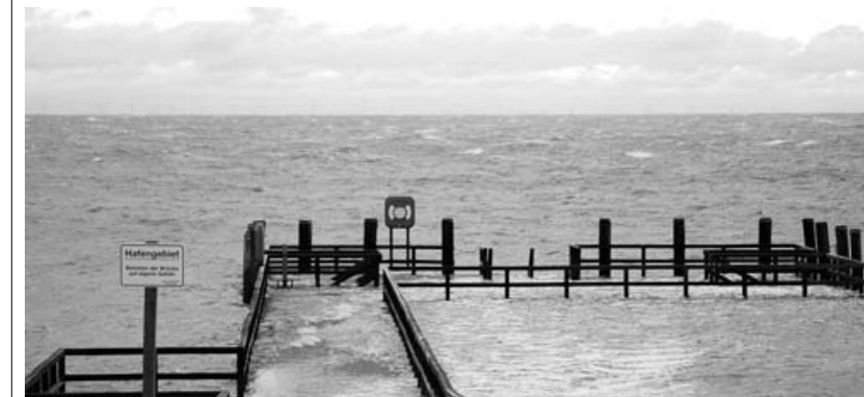
Die Wyker Mittelbrücke bei Sturmflut, Betreten nicht empfohlen...

Es ist kühl geworden. Die Blätter an den Bäumen wechseln ihre Farben und schon kurze Zeit später werden sie vom Herbstwind davongetragen. Auch die meisten Gäste werden in den nächsten Tagen die Insel verlassen. Man könnte denken, es kehre Ruhe und Beschaulichkeit ein. Einerseits. Andererseits bricht nun die Zeit an, in der Wind und Stürme zunehmen, das Meer aufgewühlt an die Küstenränder peitscht und sich hier oder da Landstücke abtricht, um sie in seiner großen Weite verschwinden zu lassen.