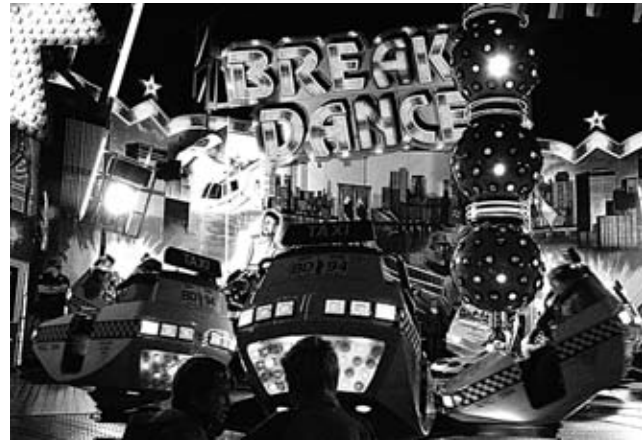
Rasanter Fahrspaß auf dem Föhrer Jahrmarkt

die es lieber rasanter mögen, ist der „Streetfighter“ und der „Break Dance“ genau das