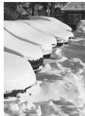
Verschneite Autos auf Föhr

richtig eingestellt sind. So wird der entgegenkommende Verkehr nicht geblendet und das eigene Fahrzeug wird frühzeitig gesehen,“ erklärt der 57jährige. Darüber hi-