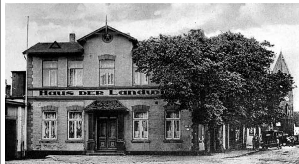
Früher waren allein zwei Tage für den Viehhandel vorgesehen

Der Föhler Herbstmarkt – bei den Insulanern schlicht Jahrmarkt genannt – hat eine Tradition die sehr weit ins 18. Jahrhundert hineinreicht. Genauer beginnt die Erfolgsgeschichte der „Harfstmarkts bi de Wyk“ im Jahre 1710, am 8. August. In jenem Jahr erhielt Wyk die Marktgerichtsbarkeit und damit die Erlaubnis zwei Märkte im Jahr zu veranstalten: einen im Frühling und einen im Herbst (nimmt man es genau, so erhielt die Stadt erst rund vier Monate nach dem ersten Markt die offizielle Urkunde). Während ersterer sich nicht so recht durchsetzen mochte, ist der Herbstmarkt bis heute die Attraktion für die Insulaner schlechthin.