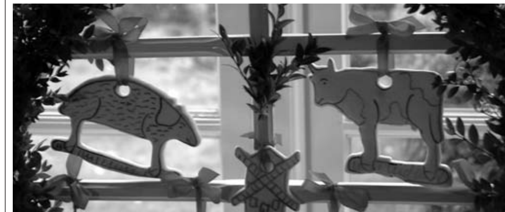
Gestaltgebäck am Friesenbaum

Die trüben, stillen Tage im November liegen hinter uns; inzwischen ist es Dezember geworden: Zeit, sich ruhig und besinnlich auf Weihnachten einzustimmen – Zeit für liebgewordene Traditionen und Bräuche. Ein ganz besonderer Brauch findet sich auf Föhr, den anderen nordfriesischen Inseln sowie den Halligen: Das Aufstellen eines Friesenbaums in der Adventszeit.