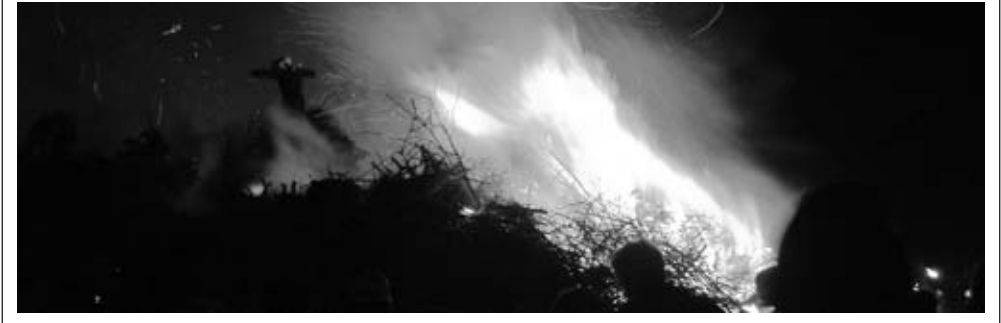
Hoch auf dem Biikehaufen thront die Strohfigur.

Das Biikefest ist ein Fest voller Traditionen. Doch im Laufe der Jahre wandelte sich dieses Fest der Nordfriesen vielerorts zur Touristenattraktion, teilweise mit Würstchenverkauf und Glühweinbuden. Damit veränderte sich auch die Organisation des Brennmaterials Wochen zuvor angeliefert und mit schwerem Gerät haushoch aufgestapelt.