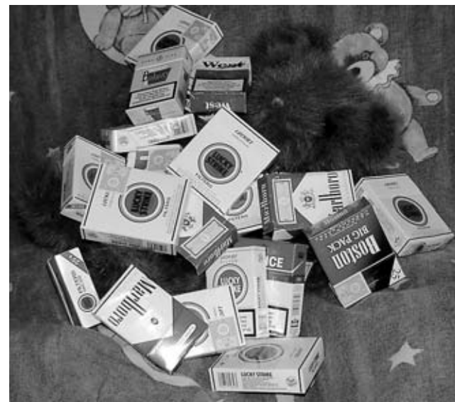
Rauchen ist für Kinder ganz besonders gefährlich.

Sonneneck. Sie weiß, welche Folgen das Rauchen für Kinder (und Erwachsene) haben kann. „Rauchen erhöht die Gefahr an Lungenkrebs zu erkranken“, so die Ärztin. Und als wäre diese Tatsache nicht schon schlimm genug, sollten Eltern wissen, dass die giftigen Inhaltsstoffe der Zigaretten auch Kehlkopf-, Lymphdrüsen- und Speiseröhrenkrebs, Hals-, Nasen- und Rachenkrebs auslösen kann.